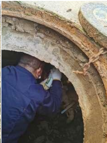
室外阀门加油保养