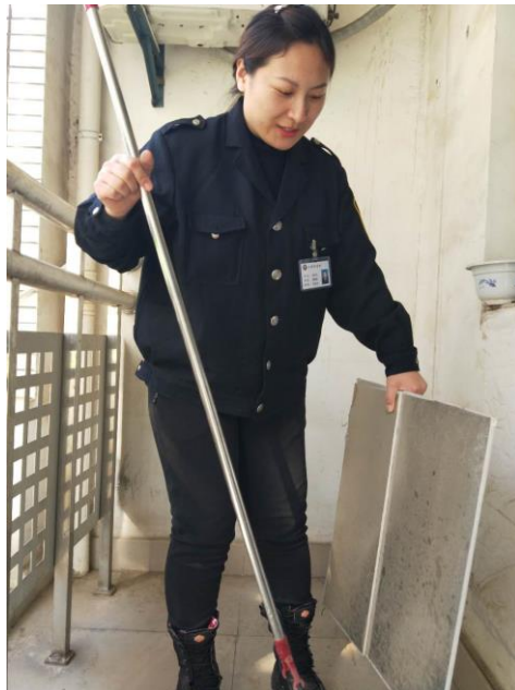
清理宿舍阳台杂物