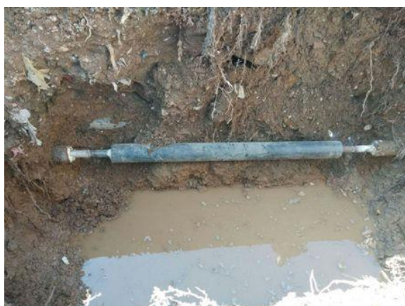
静园 C 与 D 西侧之间 (洗澡管路)