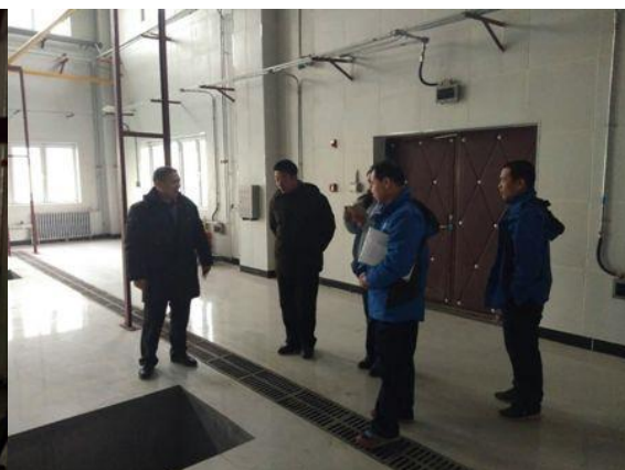
物业管理与后勤服务公司领导来东区锅炉房现场巡查