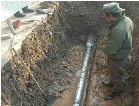
静园 B 西侧 (洗澡管路)