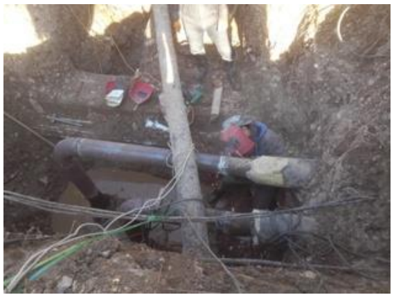
北区花园（锅炉系统管路）