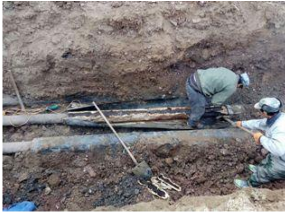
网球场西（锅炉系统管路）