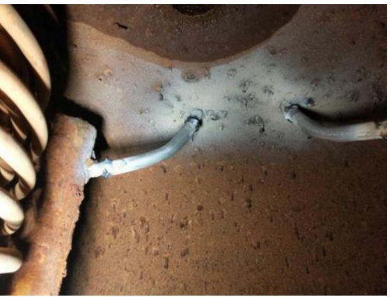
静园D换热罐（锅炉系统管路）