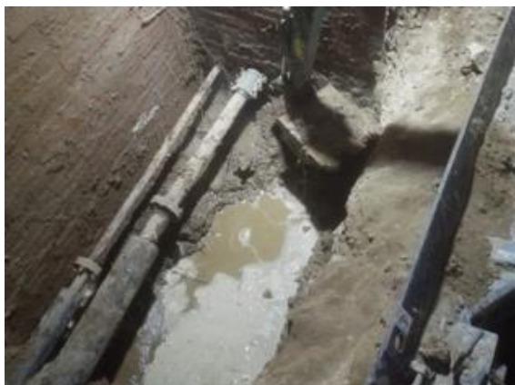
疏桐园 C 西侧 (洗澡管路)

2019年1月前后供暖供热管网漏水点多达10处(明细如图),其中 供热(洗澡水)管路漏水维修5次;锅炉系统管路漏水维修5次。