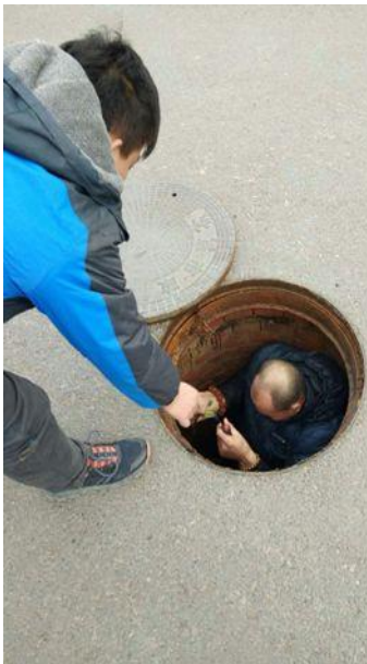
深入 6 米多深雨水管廊寻找漏水线索