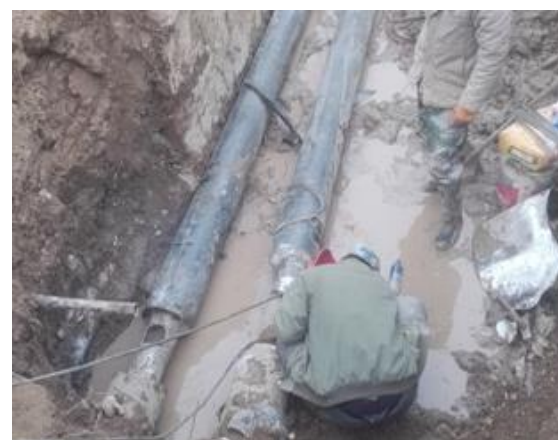
网球场西南角 (锅炉系统管路)