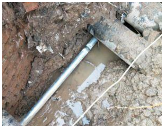
静园 D 西侧 (洗澡管路)