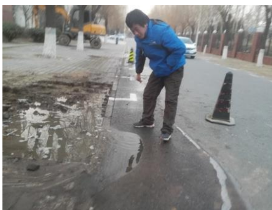
静园 C 西侧 (洗澡管路)