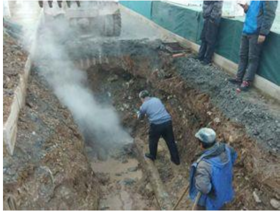
静园北侧（锅炉系统管路）