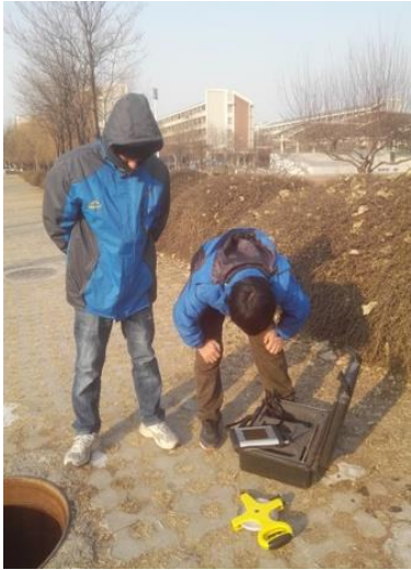
使用探测仪寻找漏点