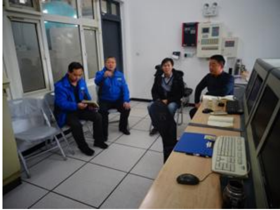
两位主管总结工作