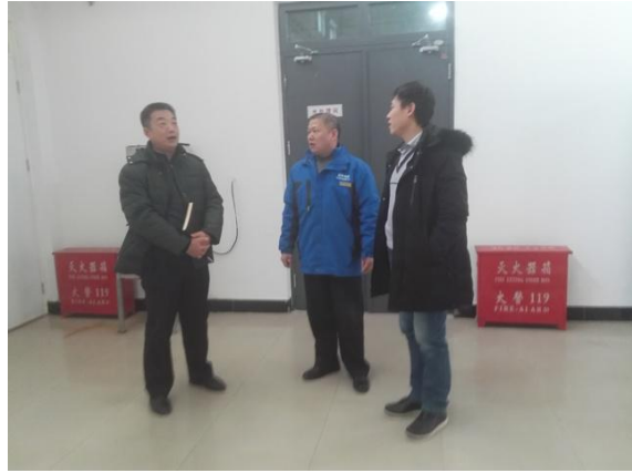
两位主任指导工作