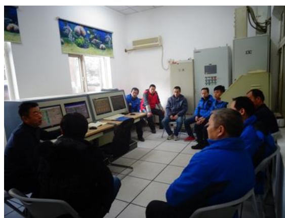
服务部人员认真倾听