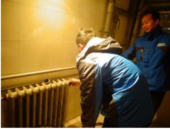
疏桐园 E 栋整楼暖气泄水