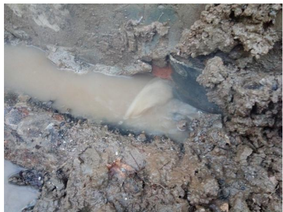
南区网球场西侧管道漏水