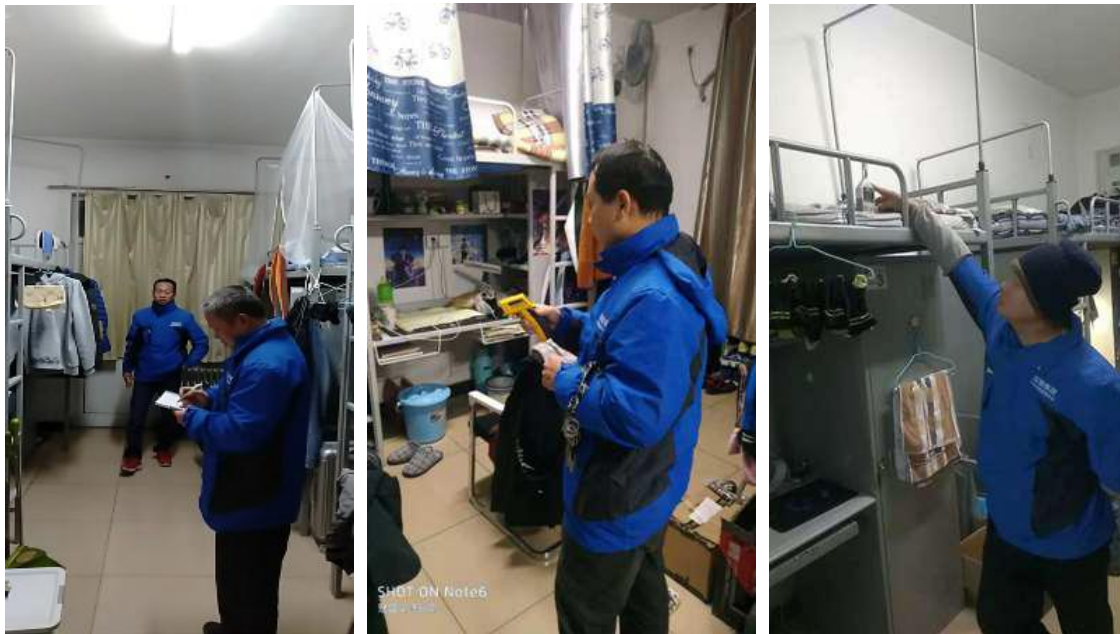
根据天气情变化多次监测室内温度

近一个月以来，我服务部人员不辞辛苦，本着以人为本、认真负责的态度，对学校供暖室温进行多次测试，掌握实际情况。根据天气情况适时调整供暖温度、循环流量、加强燃烧。打破传统模式，创造条件，尽量保证寒潮天气的供暖供热工作。