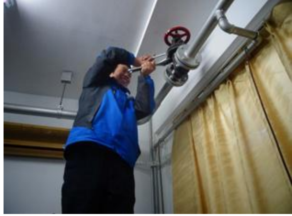
安装 DN50 阀门