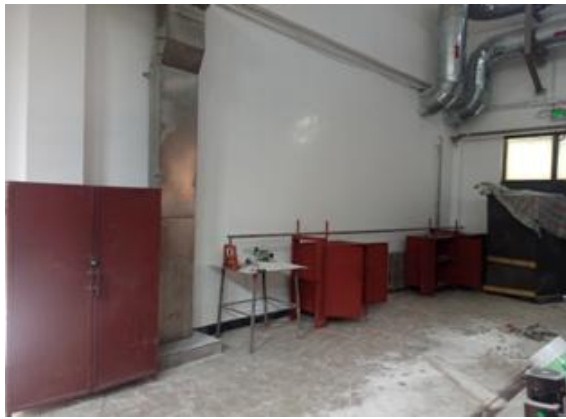
材料柜、工具柜制作完成