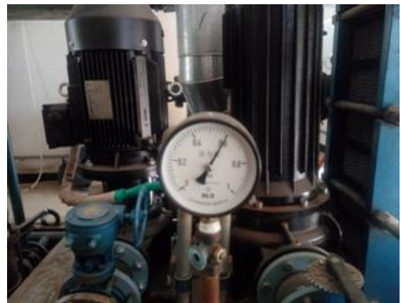
系统压力达到合格值