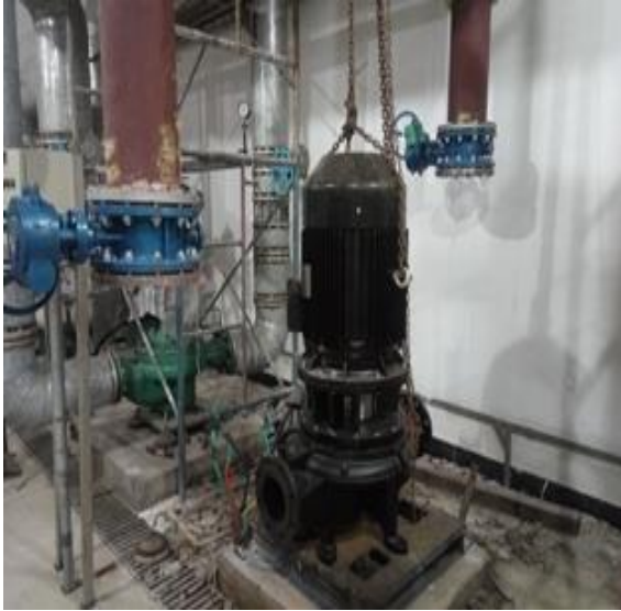
系统一次水循环泵更新