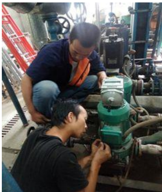
水泵电机绝缘检测

按照良乡供暖供热服务部的惯例每年 9 月份，我服务部要对良乡锅炉房和供暖供热交换站用电设施、设备进行全面检修检测。今年也不例外，我部耗时将近半个月时间，对配电柜、配电箱、控制柜进行除尘，线路检查，紧固接线端子，更换老旧配件等工作。对各类水泵进行绝缘检测，排除一切供暖供热隐患。同时也为用电安全打好坚实基础。