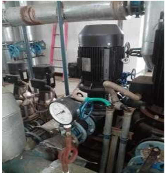
1#交换站教学区循环泵更新