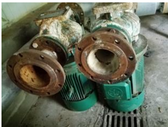
静园 D 太阳能站废弃水泵