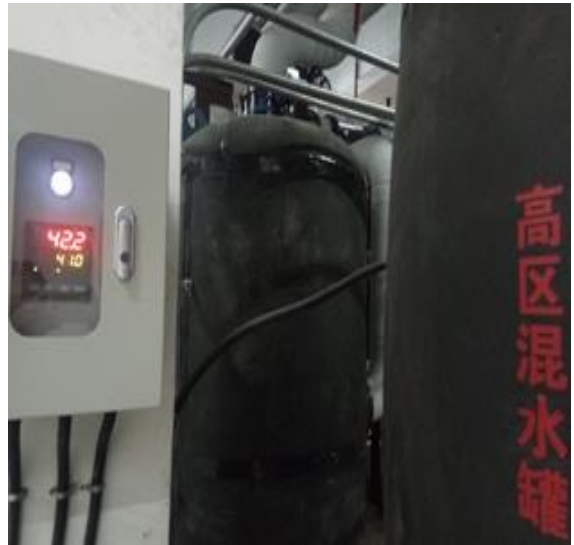
随时上传供水温度