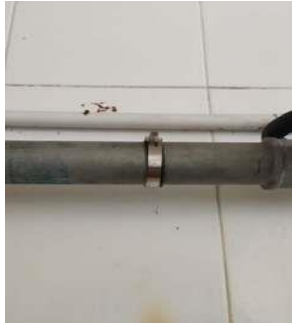
漏水管道临时处理