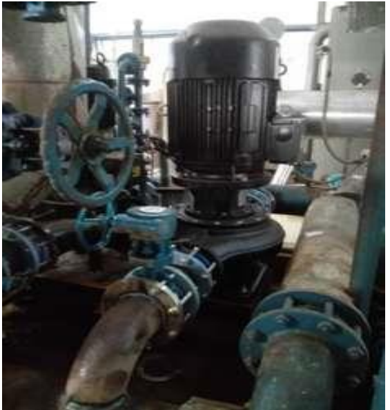
1#交换站生活区循环泵更新