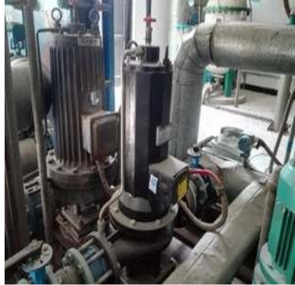
2#交换站教学区循环泵更新