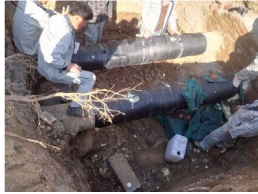
管道及伸缩器做保温