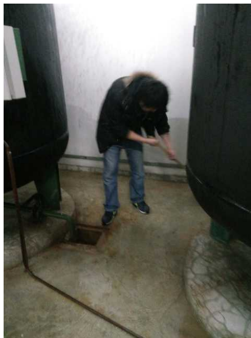
对交换站环境卫生的整理