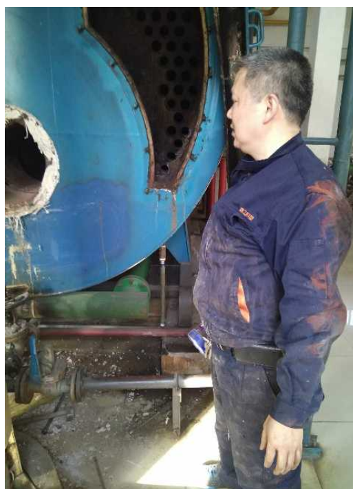
对炉膛里面的情况总结