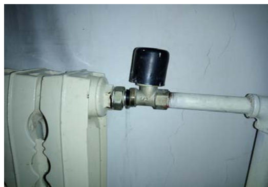
多处暖气及管道漏水