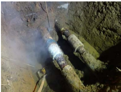
静园D北面伸缩器漏水